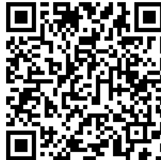
Google Earth nedlastning

Aktivitet: Diskuter og lag eksempler på hvordan du kan bruke Google Earth i en barnehage-sammenheng